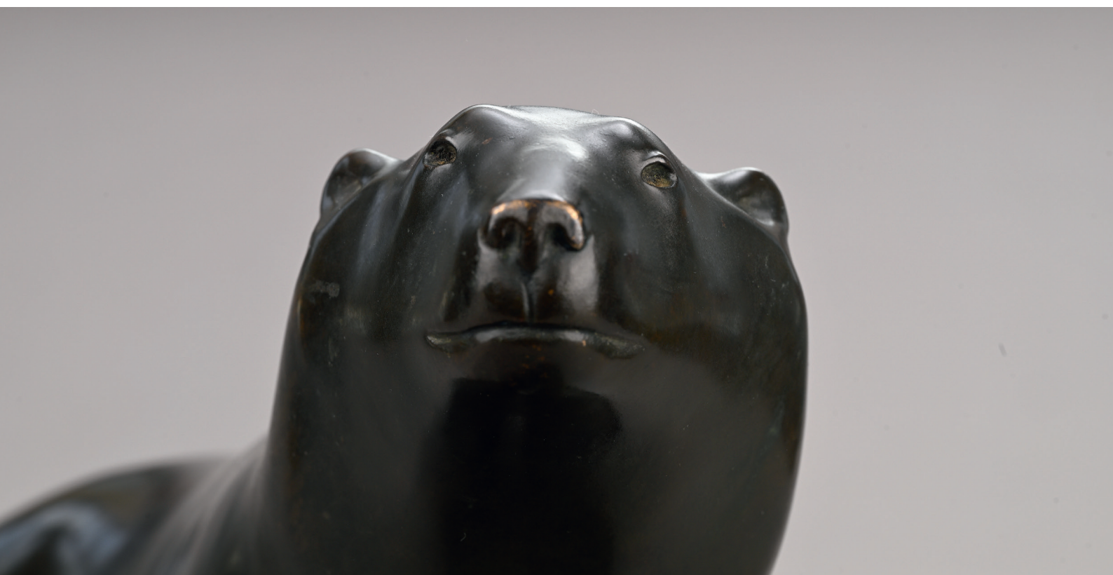
Figure majeure de la sculpture moderne, François Pompon bénéficie aujourd'hui d'un regard renouvelé, qui met en lumière la radicalité de son langage formel.

Lorsque son Ours blanc est présenté au Salon d'Automne de 1922, la simplicité extrême de ses volumes surprend autant qu'elle fascine. Son œuvre s'impose immédiatement, mais la pleine portée de sa modernité se révèle progressivement.