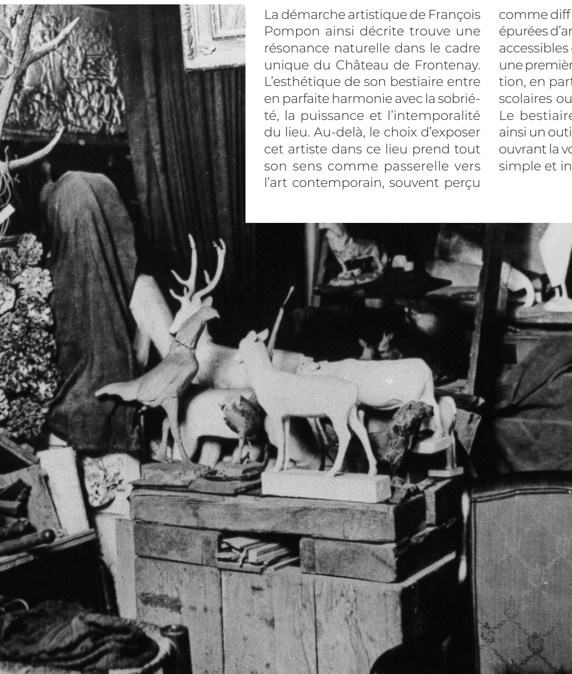
L'atelier de François Pompon

comme difficile d'accès. Les formes épurées d'animaux familiers, à la fois accessibles et évocatrices, facilitent une première approche de l'abstraction, en particulier pour les publics scolaires ou éloignés de la culture. Le bestiaire de Pompon devient ainsi un outil pédagogique sensible, ouvrant la voie à une contemplation simple et intuitive de l'art.